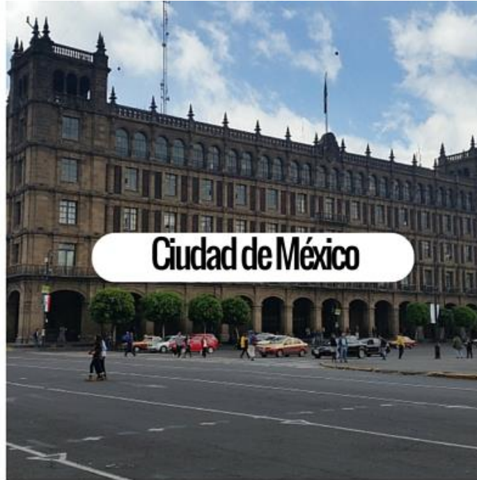
Ciudad de México